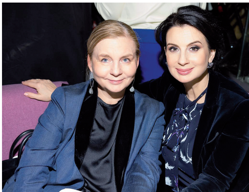
С сестрой, Екатериной Стриженовой — известной актрисой и телеведущей

— Я люблю рисовать. Насколько в юности все эти этюды наводили тоску, настолько сегодня они мою тоску развеивают. В моем саду столько цветов, а лето — такая большая маленькая жизнь, что нет конца моему вдохновению. ■